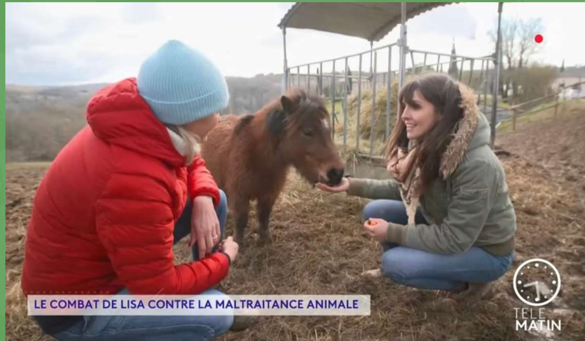
LE COMBAT DE LISA CONTRE LA MALTRAITANCE ANIMALE